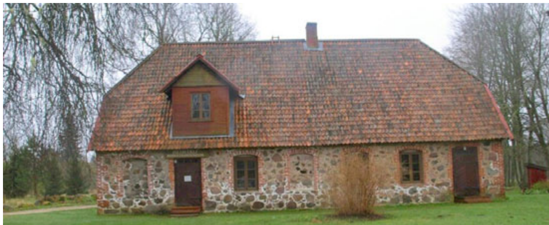
Lisa 3. Isikumuuseumite võrdlustabel

Alates 2010. aasta maikuust kuulub Heimtali muuseum Eesti Rahva Muuseumi koosseisu.